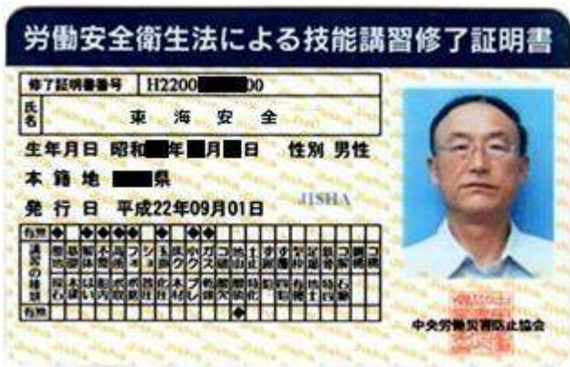
添付例① 技能講習修了証明書発行事務局発行の技能講習修了証明書(統合カード)

以下のように特別教育の講師となった方の、 技能講習修了証のコピーを実務経験証明書下欄へ添付して下さい。 (例)会社内で実施した特別教育の講師が東海安全さんの場合