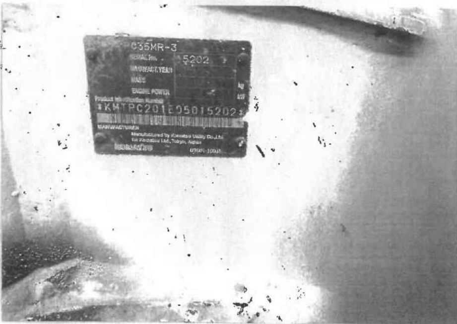
機械の写真(全体写真、および製造番号刻印部の拡大写真)